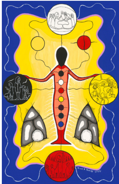
Une représentation de la norme d'exercice Connaissances professionnelles

Les membres de l'Ordre visent à tenir à jour leurs connaissances professionnelles et saisissent les liens qui existent entre ces connaissances et l'exercice de leur profession. Ils comprennent les enjeux liés au développement des élèves, aux théories de l'apprentissage, à la pédagogie, aux programmes-cadres, à l'éthique, à la recherche en éducation, ainsi qu'aux politiques et aux lois pertinentes. Les membres y réfléchissent et en tiennent compte dans leurs décisions.